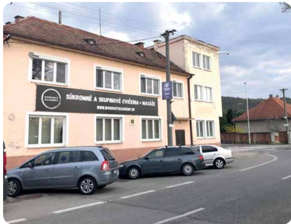
Prenájom budovy na rohu Eisnerovej a Istrijskej ulice vyvoláva otázky o efektivite vynaložených prostriedkov.

teľ z Devínskej Novej Vsi, ktorému záleží na tom, kde žije a ako sa hospodári v jeho mestskej časti. Podnet, ktorý nám poslal totiž nadpis „ Nie sme tak chudobní, aby sa tu nemohlo žiť lepšie. “