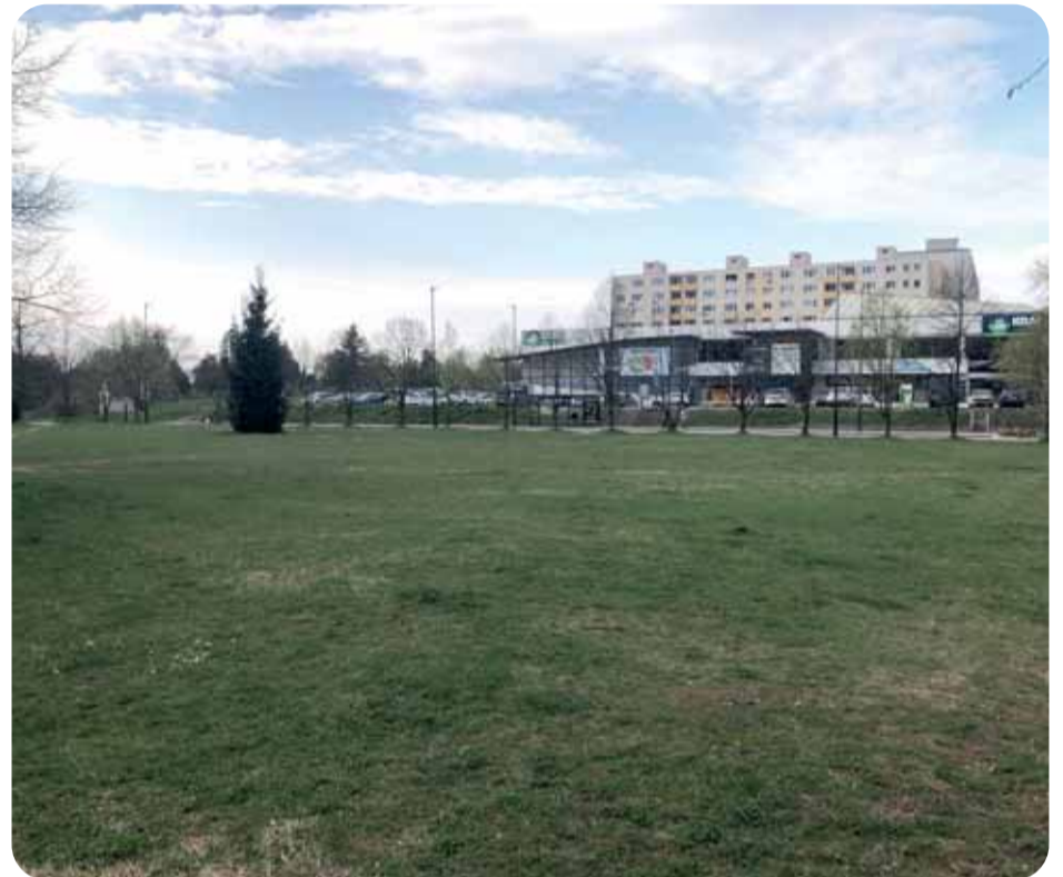
Prenájom plochy za účelom kultúrno.spoločenských akcií nedáva zmysel, nakoľko sa všetky akcie mestskej časti konajú inde.

mum aktivít. Aj to len na 1. poschodí, ktoré mestská časť prenajíma Workout Academy s.r.o, inými slova-