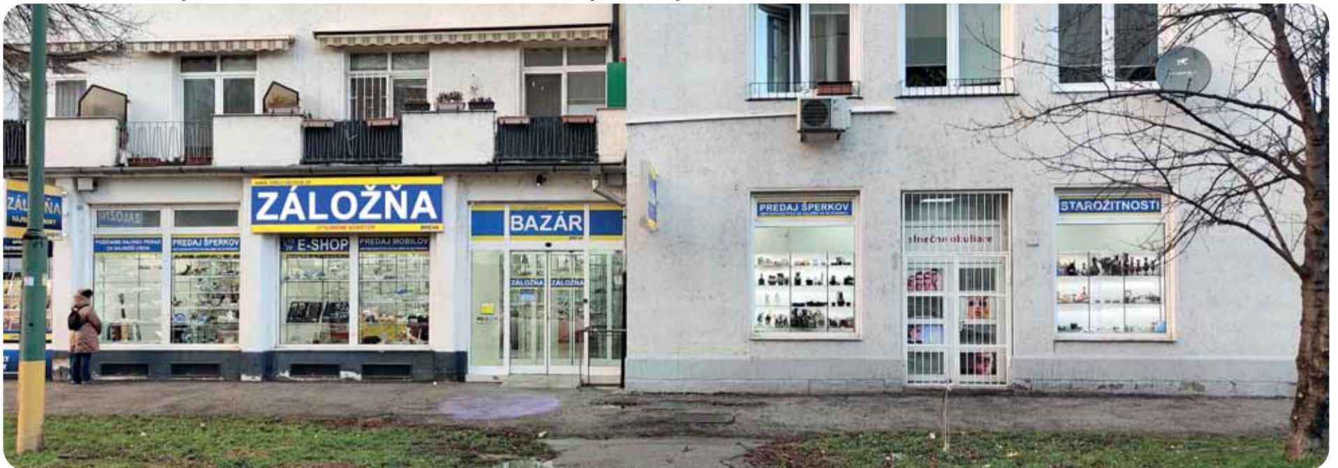
Záložňa Brevna na Páričkovej ulici, hneď vedľa Nivy centrum, patrí medzi najproblematickejšie.

Prevádzky záložní bez jasných pravidiel zhoršujú bezpečnosť aj kvalitu života vo viacerých lokalitách Bratislavy. Samosprávy upozorňujú, že najmä nonstop záložne priťahujú kriminalitu a stávajú sa centrom problémového správania, ktoré zhoršuje život ostatným obyvateľom.