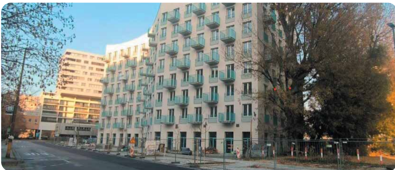
Najnovšie mestské nájomné byty vyrástli na Muchovom námestí v Petržalke.

Zároveň pripomenul, že vláda viedla náročné rokovania s Európskou komisiou, aby zabezpečila výhodnejšiu sadzbu DPH na úrovni 5 %, ktorá nebude považovaná za neoprávnenú štátnu pomoc. Diskusia s Komisiou môže pokračovať aj ohľadom ďalších možností podpory tohto sektora.