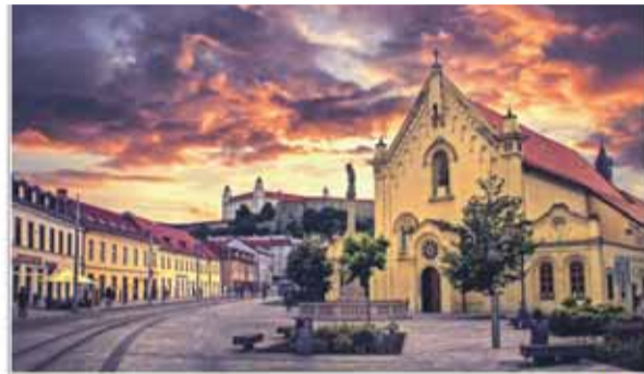
BRATISLAVA, ŽUPNÉ NÁMESTIE

Historické Staré Mesto sa z rôzneho uhla v záplave zapadajúceho Slnka môže zdať priam rozprávko. Mestské uličky evokujúce historické európske mes-