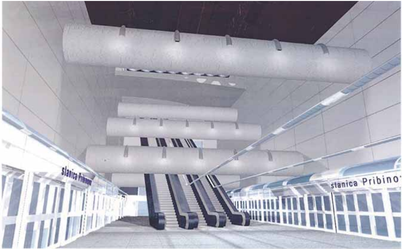
Metro Bratislava (VAL-MATRA) (január 1999)

Keď som bol nedávno v Prahe na jednej exkurzii k výstavbe metra, ktoré robia už ďaleko von z Prahy, tak som sa ich pýtal, že prečo ho robia na území, kde nikto nebyva, ktoré je neobývané. A povedali mi: „Pane inženýre, práve preto“. Kde vznikne stanica metra, tak tam bude aj stavebný ruch a bude tam výstavba. Bolo to smerom na