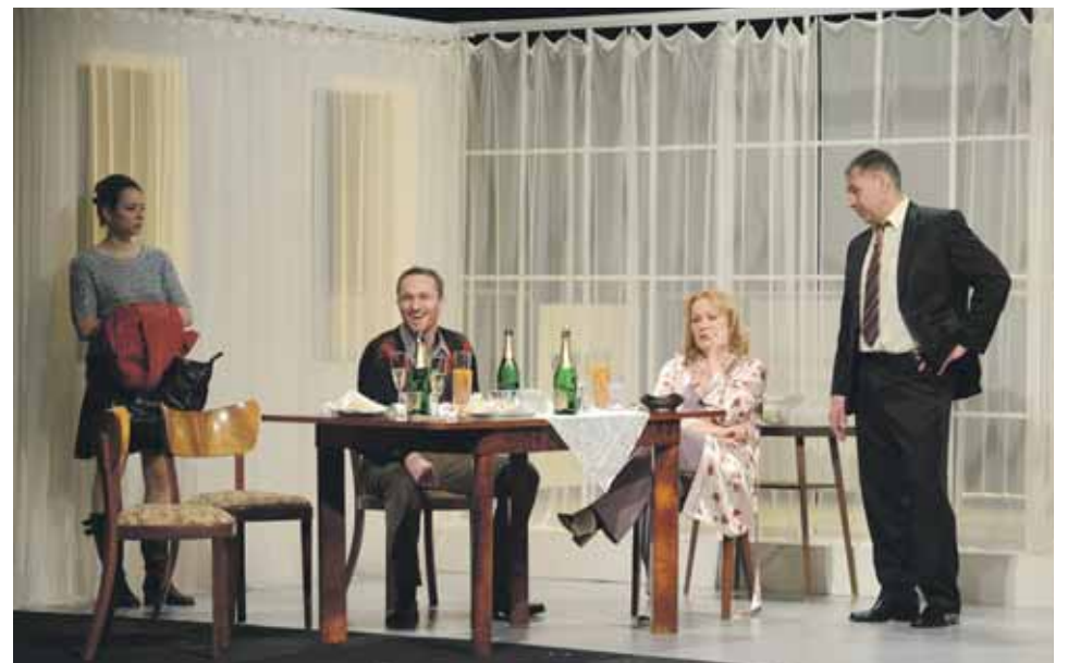
Predstavenie Doktor Macbeth zachytáva prvý týždeň Nežnej revolúcie.