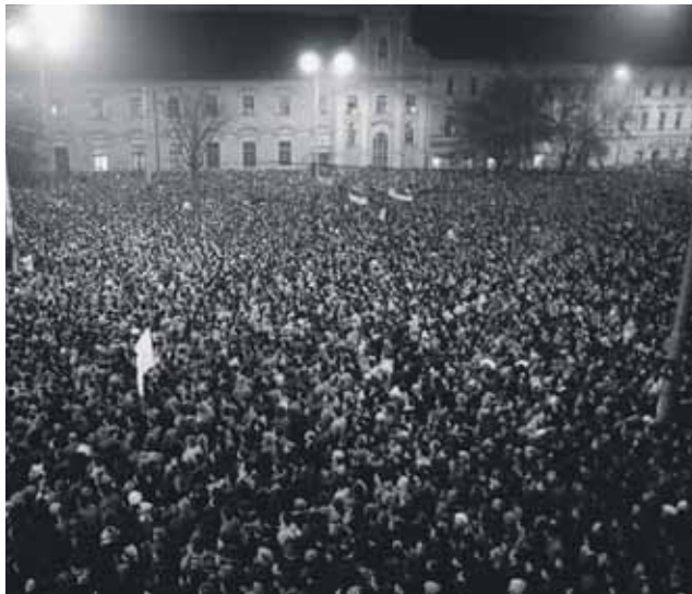
Bratislava a Nežná revolúcia ponúkne dobové fotografie zachytávajúce pád komunizmu na Slovensku.

Tri výstavy, premietať divadelnej hry a živá diskusia. Toto všetko čaká už túto sobotu – 16. novembra návštevníkov